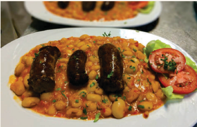
lăhnie de fasole cu cârnaț/costiță 300/250g | 46