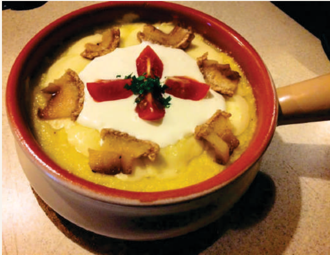
Mămăliguță ardelenească cu slăninuță prajită si burduf 500g | 26